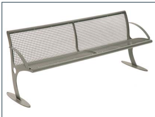
Molla Drahtgitter-Ausführung Art.-Nr. 170 004